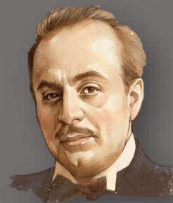
Kahlil Gibran ( 1883-1931) Van dag tot dag – 3 januari

De nacht sprak tot hem met de stem van de Vader en in de eenzaamheid hoorde hij hoe de engel van de Heer hem toeriep. En als hij zich ter ruste legde, hoorde hij in zijn dromen de hemelen fluisteren.