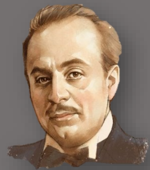
Kahlil Gibran ( 1883-1931) Van dag tot dag – 16 april

rampzalige onderkomens. Hij kwam om het hart van de mens tot een tempel, de ziel tot een altaar en de geest tot een priester te maken.”