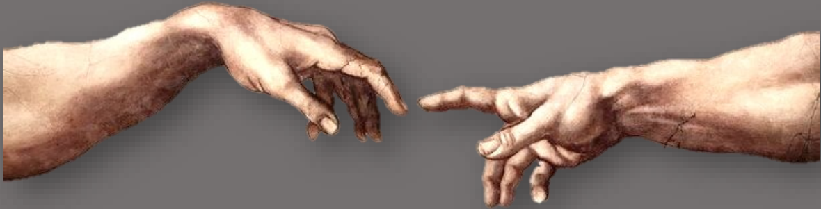
BEELD: MICHELANGELO – DE SCHEPPING VAN DE MENS

Maar ja, in dit laatste stuk van het verhaal bleek het een Alwetende te zijn. En heel nozel!