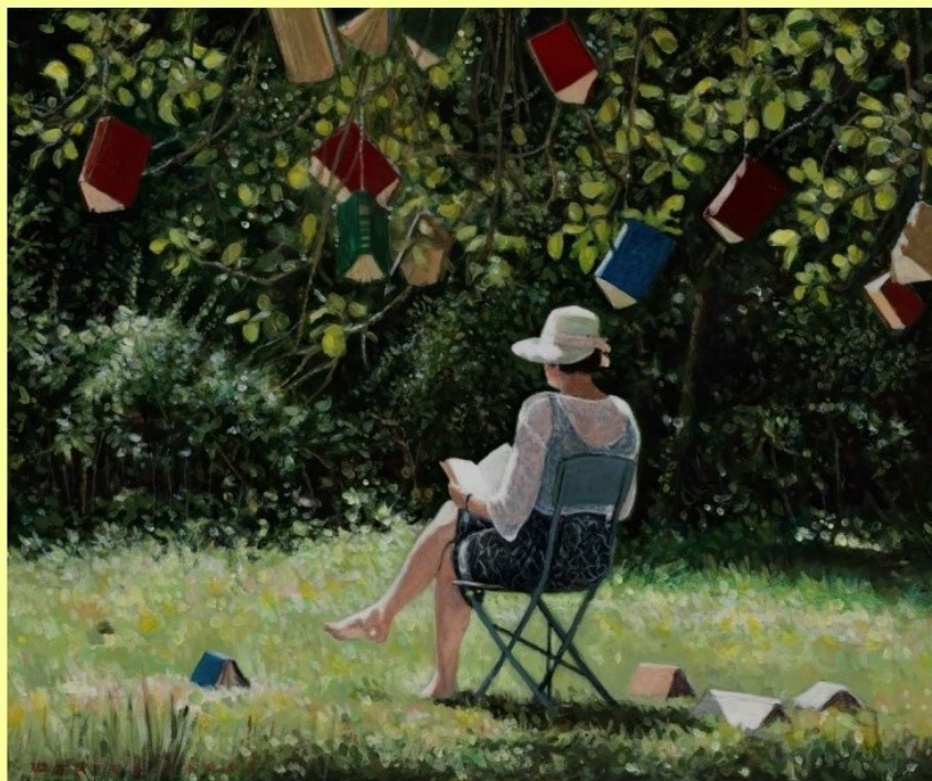
SCHILDERIJ: 'ONDER DE BOEKENBOOM' – WOUTER BERNIS