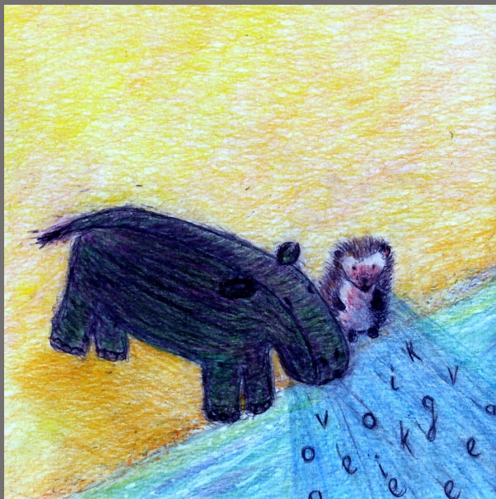
ILLUSTRATIE EN VOLGENDE TWEE CIATEN: WINNY BOGAARDS

En met bolle wangen bliezen Egel en Nijlpaard Nijlpaards woorden naar de overkant van de zee.